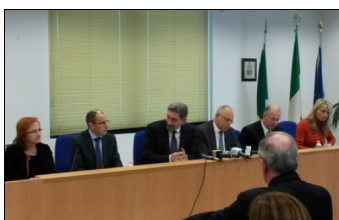
La conferenza stampa della delegazione regionale

Brescia. Si è conclusa con l'incontro con la stampa locale la prima parte della giornata bresciana per una folta delegazione del Consiglio regionale lombardo, guidata dal presidente Raffaele Cattaneo. Nell'ambito del progetto "100 tappe in Lombardia", la rappresentanza dell'assemblea regionale, guidata dal presidente Raffaele Cattaneo accompagnato da molti dei consiglieri che Brescia ha mandato in Regione, ha dedicato la prima metà giornata all'incontro con le istituzioni, "per ascoltare - ha affermato Cattaneo - le istanze del territorio perché possano essere di riferimento per il ruolo di indirizzo politico che è del Consiglio regionale".